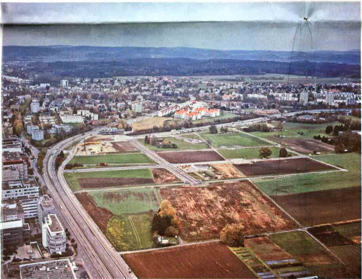
Im Luftbild vom 13. November 2004 sind die fertig gestellten Strassen und Alleen der ersten Etappe sowie die Baustelle Lightcube gut sichtbar.